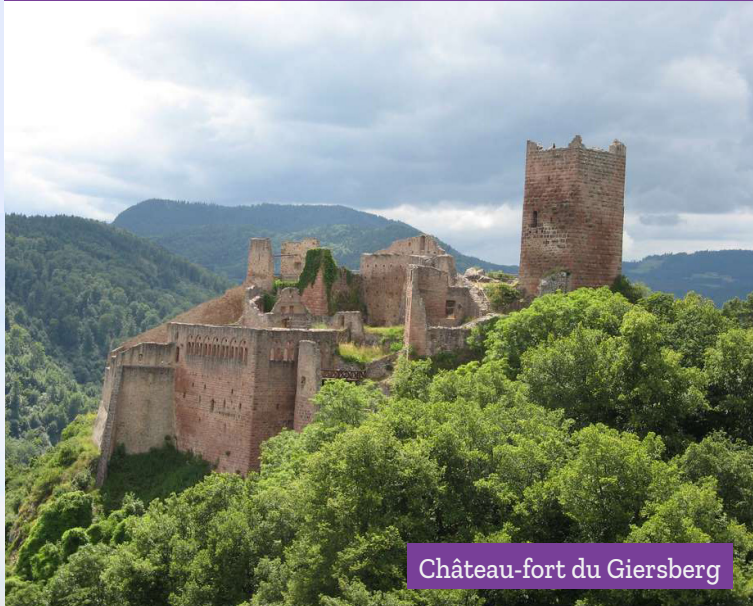
Château-fort du Giersberg